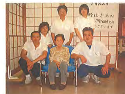
【職員と利用者さん】