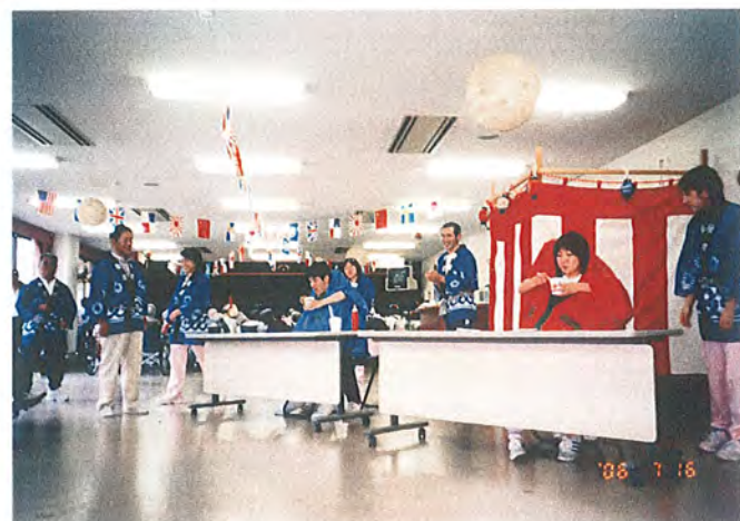
7月16日:寿和苑納涼祭

職員の二人羽織で、カキ氷の早食い競争です。利用者さんの前では、普段見ることの出来ない顔を、みなさんに紹介できました。